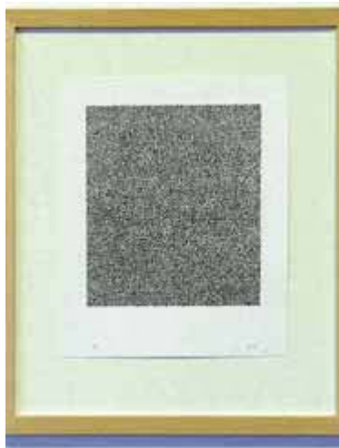
Teikning Einn Passíusálmanna.

„Nei, í stuttu máli sagt þá mistókst hvort tveggja!“ Hann hlær. „Það tók mig í allt níttján mánuði að