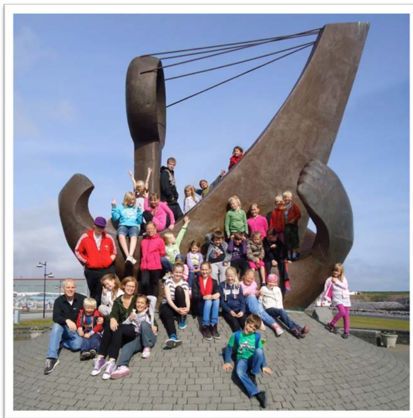
Nemendur og kennarar í Listaskóla barna sumarið 2011.

Í tengslum við sýningarnar sem settar eru upp í Listasalnum fer fram mikil heimildaöflun um hvern einasta listamann. Þessar heimildir eru allar geymdar í skrá safnsins.