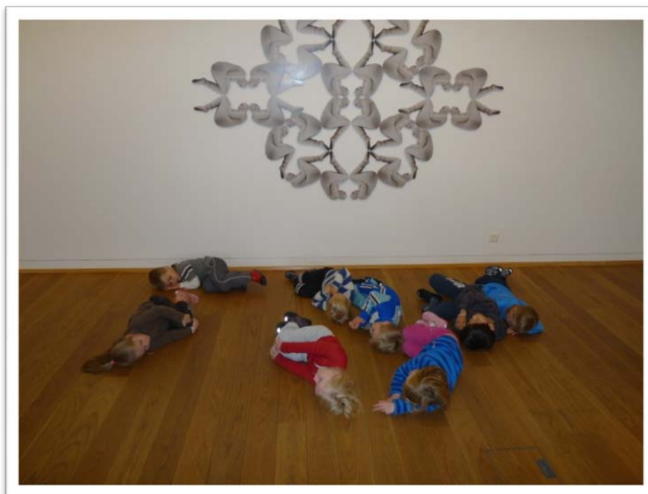
Leikskólabörn að herma eftir listaverki á sýningunni Dúkkú.