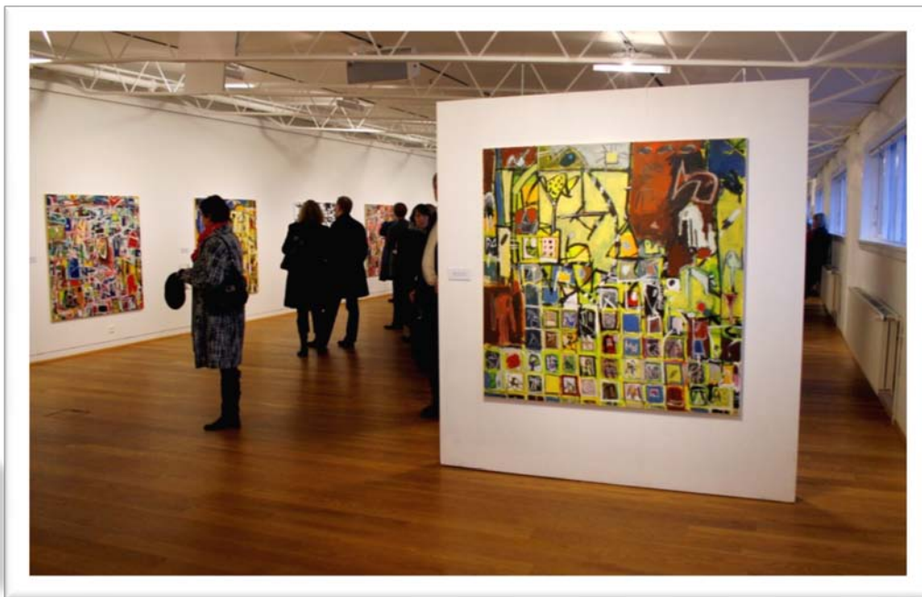
Frá sýningunni Augastaðir