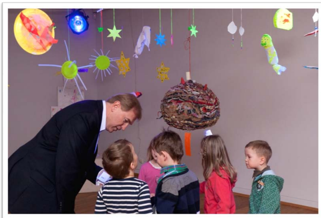
Bæjarstjórinn skoðar listaverk með leikskólabörnum á sýningunni Himingeimurinn á Listahátíð barna.

Lykillinn að velgengni Listaskólans liggur auðvitað fyrst og fremst í leiðbeinendum sem stýra starfinu. Gallinn er sá að töluverð óvissa getur ríkt um þá allt fram á síðustu stundu. Í sumar vorum við sérlega heppin með fólk. Boðið var upp á mjög metnaðarfullt námskeið, með fjölbreyttum verkefnum þar sem hugað var að þörfum hvers og eins barns. Það er mjög mikilvægt að börnum í bæjarfélaginu standi námskeið af þessu tagi til boða sem kemur til móts við þarfir þeirra sem hafa ríka sköpunargleði og listtengdan áhuga. Tilfinning er sú að vel hafi tekist til í sumar og að allir sem að komu, börn, foreldrar og starfsfólk hafi verið ánægð með afraksturinn.