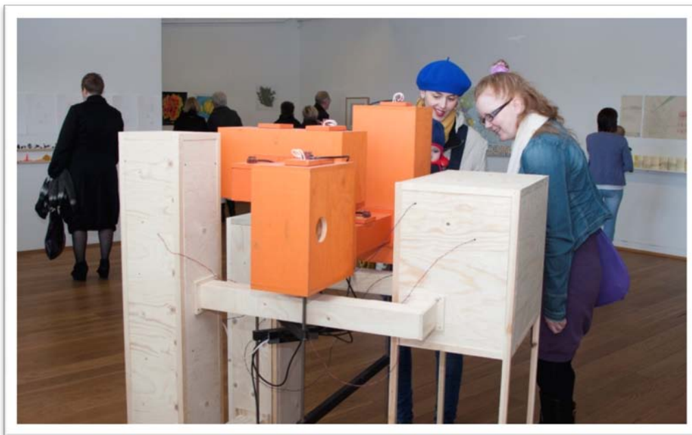
Áhugsamir gestir skoða verk á sýningunni Eitthvað í þá áttina.