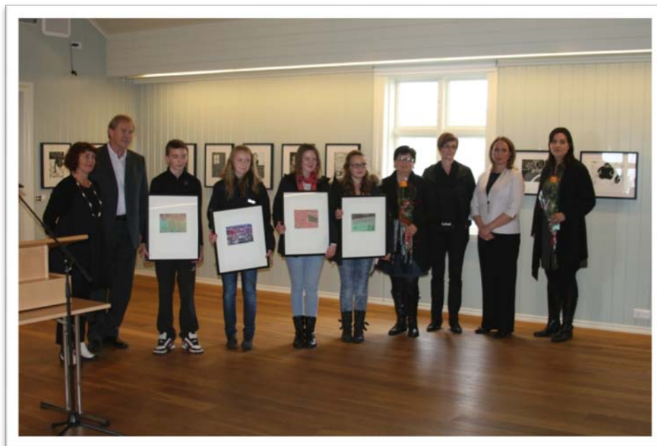
Við opnun sýningarinnar Óvættir og aðrar vættir. Nemendur Myllubakkaskóla með verk sín.